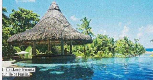
Le Constance Lémuria, sur l'île de Praslin.

Réduire les Seychelles à une simple succession d'îles paradisiaques serait bien mal connaître la destination... Certes, l'archipel compte son lot de cocotiers et de plages idylliques. Mais c'est aussi un véritable concentré de nature où se mêlent végétation luxuriante, tortues géantes, cocos-fesses (noix de coco aux formes suggestives), rochers granitiques, réserves ornithologiques et sanctuaire marin. Le tout sur fond de traditions créoles et de légendes de pirates, pas si fantasmées que ça... Un petit paradis, donc, qui a su dompter le tourisme et l'hôtellerie à l'aide de critères rigoureux comme celui de l'intégration dans l'environnement. Si les règles se sont assouplies avec les années, il n'en reste pas moins quelques exemples notables. Tel le Constance Lémuria, ouvert en 1999 le long des superbes anses Kerlan au nord-ouest de Praslin, deuxième plus grande île des Seychelles après Mahé. Soit, à l'époque, le premier 5 étoiles de l'archipel. Depuis, l'enseigne est restée fidèle à ses principes : sauvegarder l'écosystème, s'inscrire dans la culture locale et pousser le confort au summum.