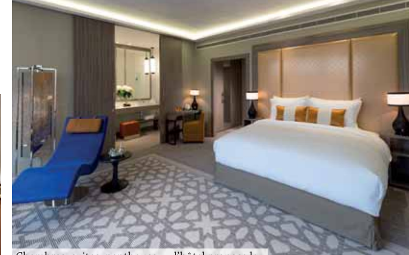
Chambres, suites, penthouse, ... l'hôtel propose la plus grande capacité d'hébergement de Marrakech