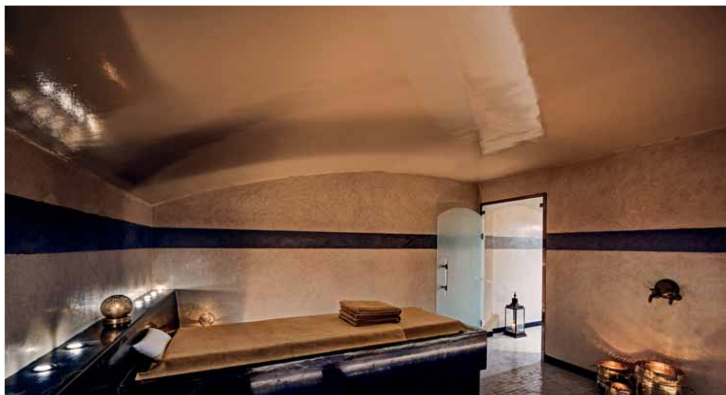
Ô de Rose est un spa Cinq Mondes avec 9 cabines de massage, salon de coiffure, jacuzzi, hammam, piscine