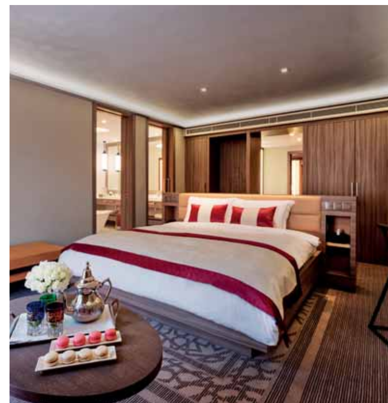
Scannez le QR Code pour découvrir d'autres photos