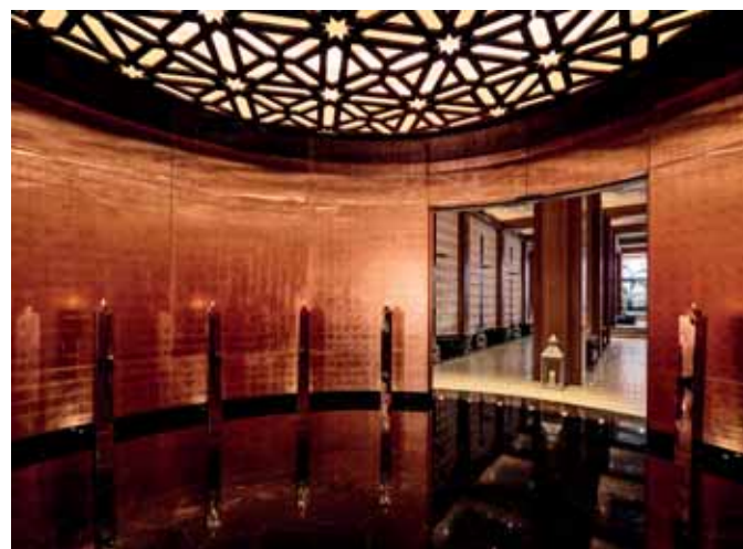
Hall entre-chambres avec sa coupole façonnée

L aura fallu pas moins de 3 années de travaux orchestrés par le Studio parisien MHNA pour repenser le lieu et en faire un 5 étoiles digne des plus grands.