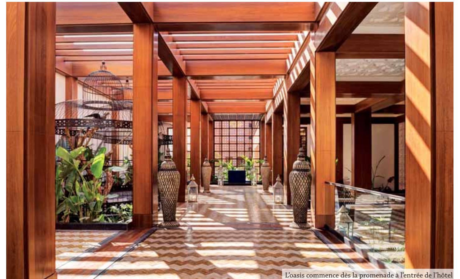
L'oasis commence dès la promenade à l'entrée de l'hôtel

Pour ceux qui fréquentaient le Mansour Eddhabi avant les travaux, la façade reste familière, mais il en est tout autrement une fois à l'intérieur! Le Mövenpick Mansour Eddahbi Marrakech est tout simplement un nouveau lieu dans un nouvel écrin sublimé. Le fil rouge est le même : les souvenirs et empreintes de Mansour Eddahbi, le plus grand sultan de la dynastie saâdienne!