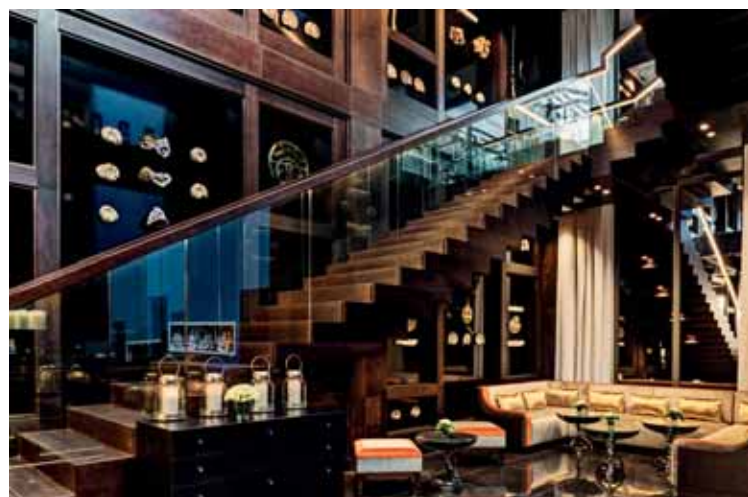
Vue sur l'entrée du Manso Lounge &amp; Rooftop