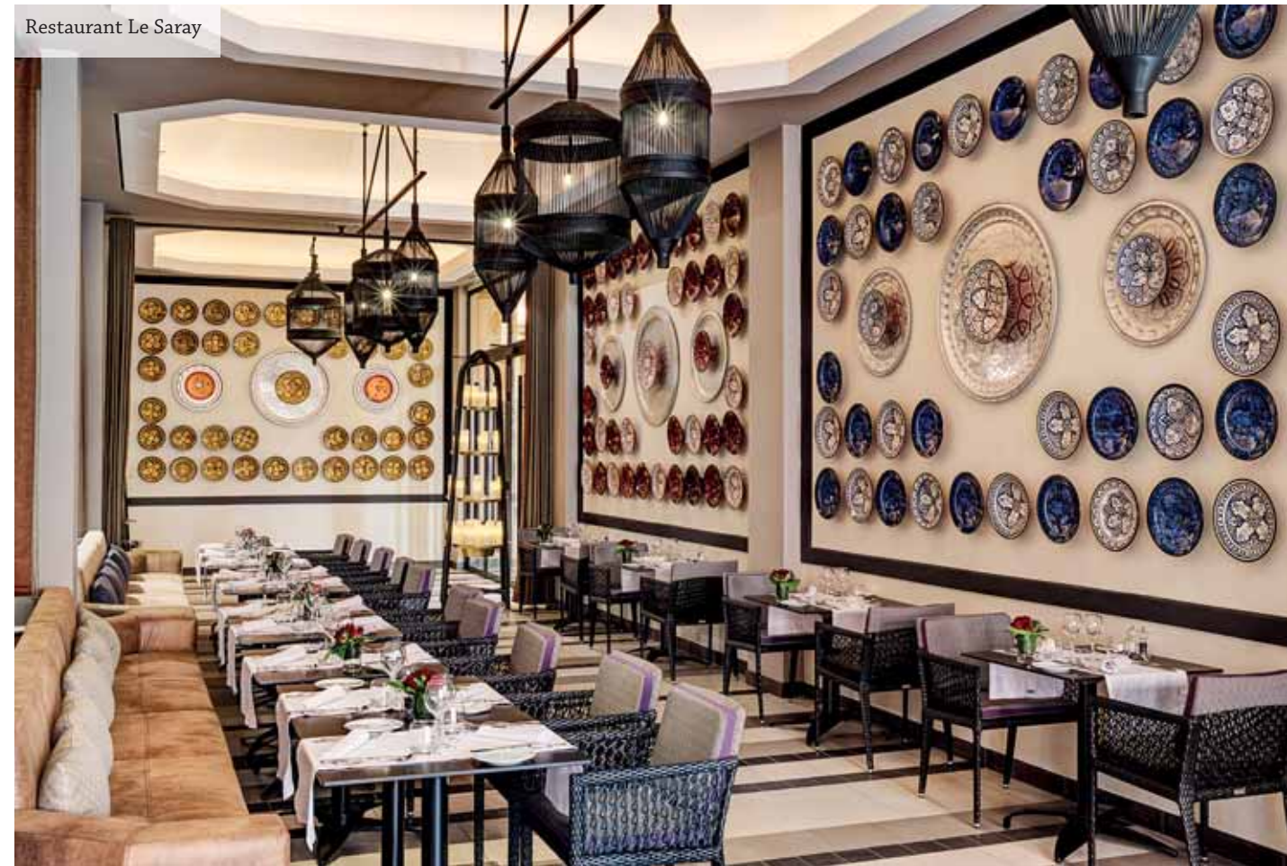
Restaurant Le Saray

Des faucons géants en cuivre dans des cages sur la promenade à l'entrée de l'hôtel, une entre-chambres aux murs habillés de feuilles de cuivre pour reposer vos yeux avant d'entrée dans le lobby, un lustre de 12 m de haut et de 2,70 m de diamètre en forme de goutte d'eau en cuivre et constitué d'anneaux en inox poli miroir supportant 935 bougies LED (celui-ci réalisé par des artisans venant d'Asie), une sphère armillaire fixée à une verrière à 10 m de hauteur,