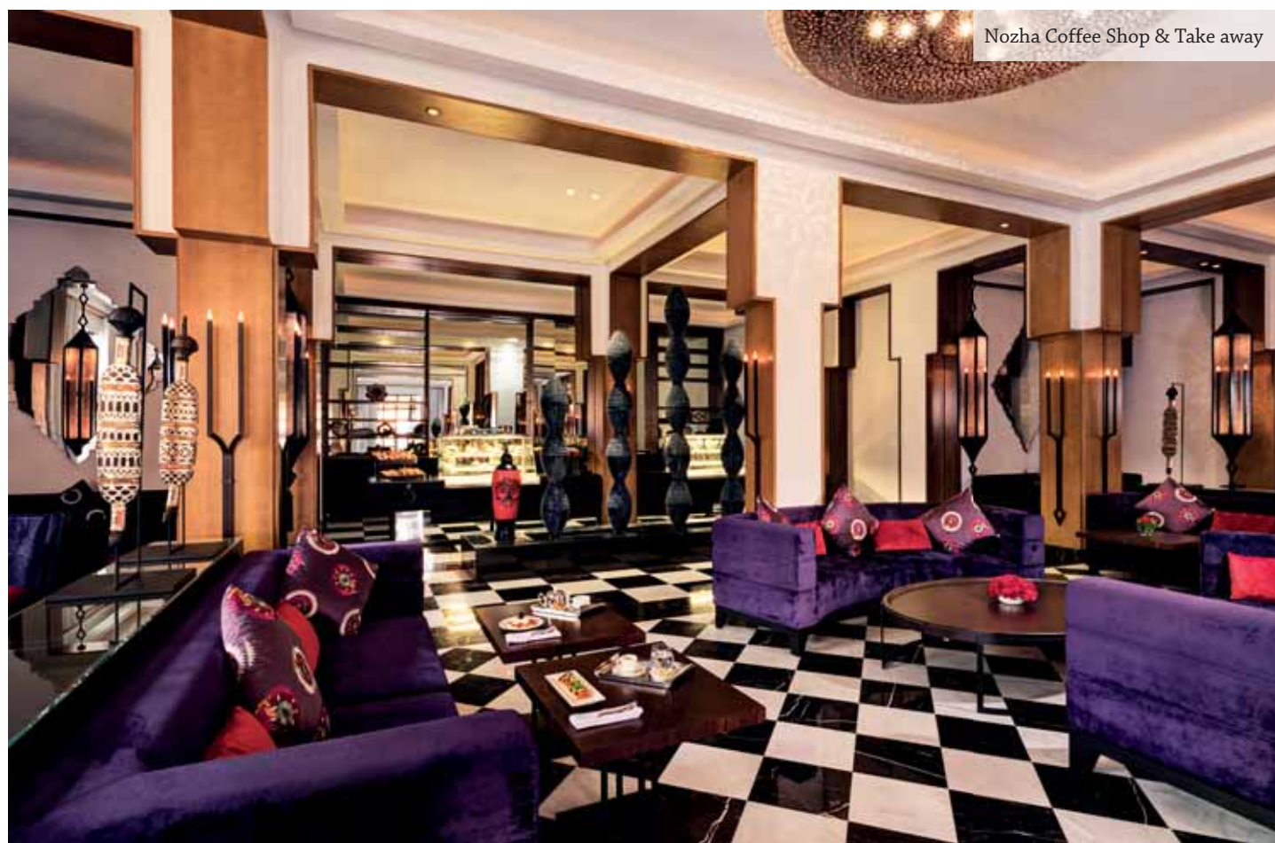
Nozha Coffee Shop &amp; Take away