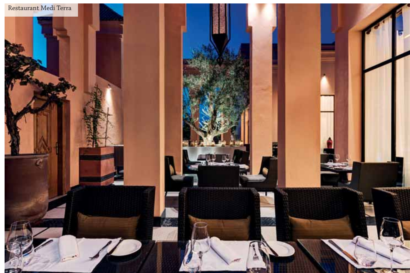
Restaurant Medi Terra