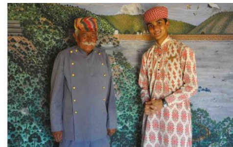
2010 Inde Udaipur - STUDIO MHNA