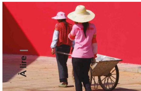
2013 GUILIN - STUDIO MHNA