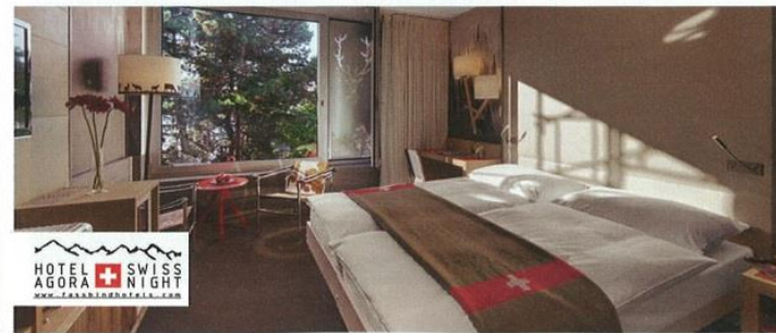
HOTEL SWISS AGORA NIGHT www.fassbindhotels.com

www.fassbindhotels.com/fr-hotel-agora.html