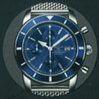
Breitling Superocean Heritage Chrono