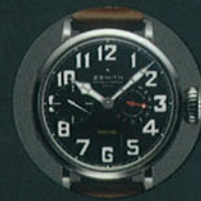
Zenith Pilot Montre d'Aeronef Type 20

Glashütte. Предельно персонализированный мост