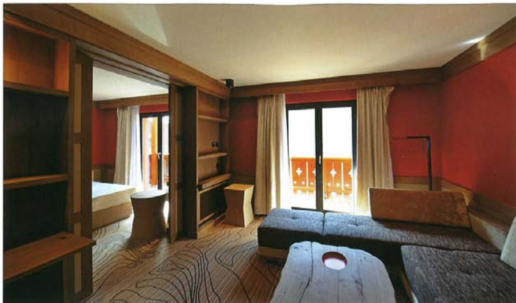
Dans chaque salon, chambre ou suite, une attention particulière a été accordée aux matériaux nobles et aux belles matières.