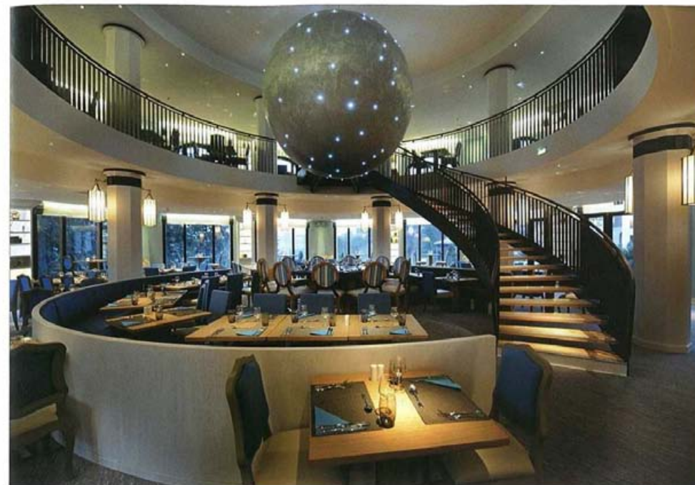
Ambiance chaleureuse d'un établissement de montagne, décor cosy et contemporain... Tous les espaces mis en scène par Marc Hertrich et Nicolas Adnet jouissent de cette atmosphère. Dans le Relais d'Automne (ci-dessous), deux cerfs, dont les bois ont été transformés en chandeliers monumentaux, trônent sur la table d'hôtes. Dans l'Observatoire d'été (ci-dessus), les astres se sont invités...

Pour le Village 4 Tridents, dominé par la couleur rouge, mais aussi pour l'ensemble du site, seuls des matériaux nobles et de belles matières (bois, pierre, velours, cuir, etc.) ont été choisis. Dès le lobby, les hôtes, accueillis par « une grande table monastère stylisée, éclairée par des lustres à balustres et bras en bois argenté », commencent leur voyage au cœur d'un univers hors du temps. Chaque espace a été soigneusement personnalisé et traité avec un grand raffinement, du spa à la piscine, en passant par les lieux pour enfants où un véritable ice bar ravit les adolescents. Dans le bar principal, de surprenantes tables-rochers ont trouvé place, tandis que dans le salon octogonal rouge de l'étage, une belle charpente traditionnelle évoque la montagne.