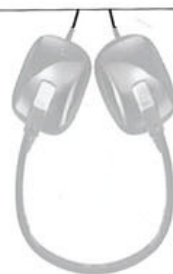
Casque pliable HA-S650-E JVC