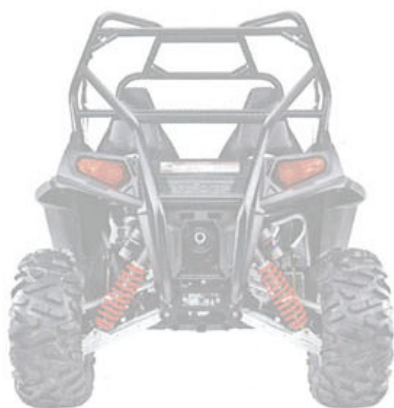
Ranger RZR S POLARIS