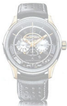
Montre AMVOX2 Transponder pour Aston Martin DBS JAEGER- LECOULTRE

Nouveau concept store Villa Moda The Gate Village DIFC DUBAI