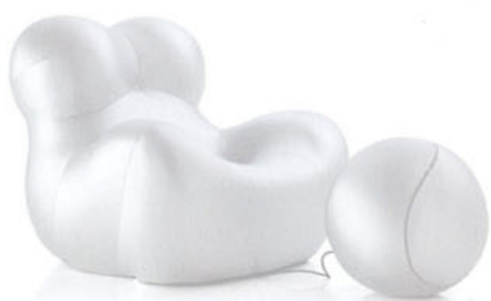
Fauteuil Up 5-6 design Gaetano Pesce B&B CHEZ MEUBLES ET FONCTION