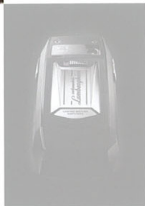
Téléphone Meridiist Automobili Lamborghini édition limitée TAG HEUER

Nouveau concept store Villa Moda The Gate Village DIFC DUBAI