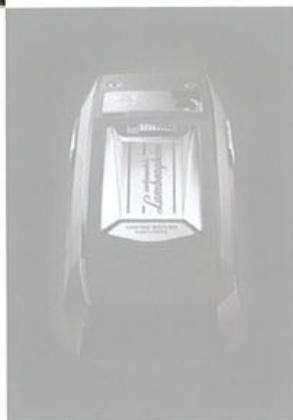
Téléphone Meridiist Automobili Lamborghini édition limitée TAG HEUER