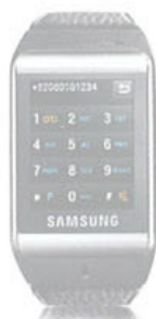
Montre-mobile S9110 SAMSUNG Baby-foot Bonzini modèle B90 DOMEAU & PERES